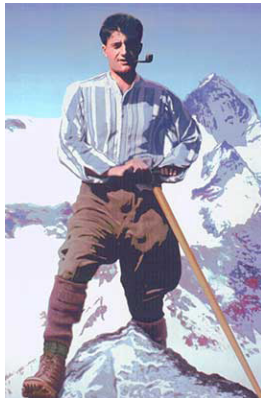
Pier Giorgio Frassati